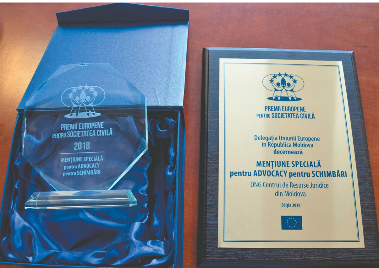
Diploma și premiul acordat Centrului de Resurse Juridice din Moldova în cadrul concursului „PREMIU EUROPEN PENTRU SOCIETATEA CIVILĂ”