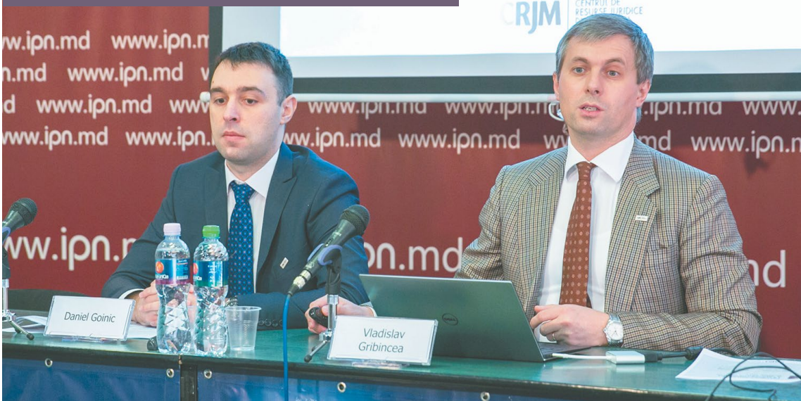
Prezentarea analizei privind situația Republicii Moldova la CtEDO

Numărul mare de arestări și de interceptări a convorbirilor telefonice confirmă implicit existența unor probleme sistemice. Aparent, una dintre acestea este activitatea judecătorilor care autorizează aceste măsuri (judecătorii de instrucție). CRJM a analizat eficiența și provocările instituției judecătorilor de instrucție cu scopul de a oferi o protecție suplimentară drepturilor omului în cadrul procedurilor penale. Am constatat că, deși în ultimii zece ani volumul de lucru al judecătorilor de instrucție aproape că s-a triplat, numărul judecătorilor de instrucție nu s-a schimbat simțitor. Acest fapt nu poate să nu le afecteze calitatea lucrului. Faptul că mulți judecători de instrucție sunt foști procurori sau ofițeri de urmărire penală nu poate să nu-și pună amprenta asupra atitudinii acestora. CRJM a recomandat introducerea în lege a interdicției de a ocupa funcția de judecător pentru judecătorii cu o experiență mai mică de câțiva ani, balansarea volumului de muncă al acestora și asigurarea unui control mai riguros al activității lor.