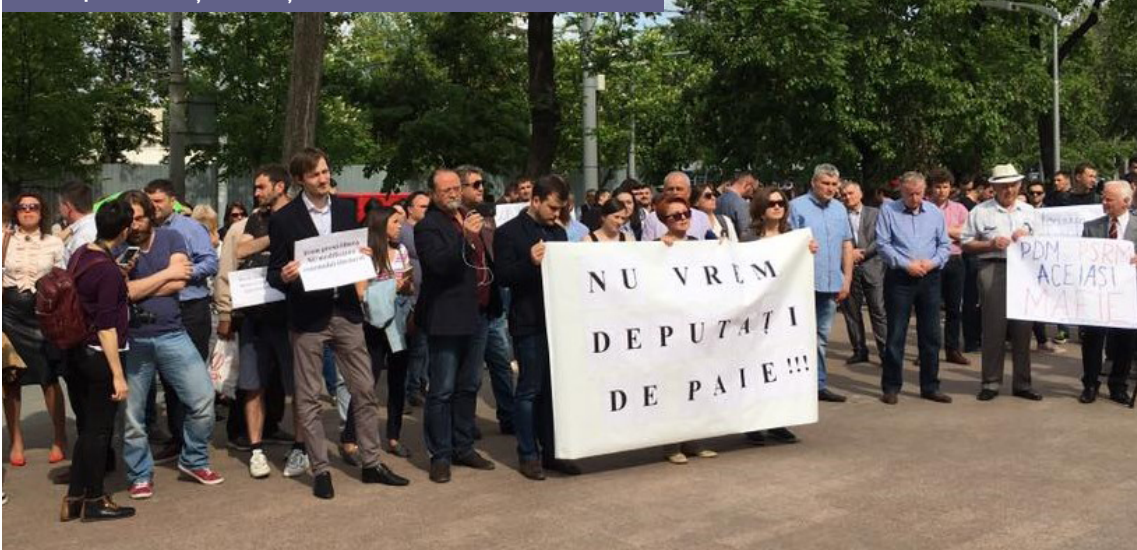
Protest pentru renunțarea la inițiativa de modificare a sistemului electoral

În primăvara anului 2017, Partidul Democrat din Moldova a înregistrat în Parlament un proiect care modifica sistemul electoral. Această modificare ar fi permis partidului să obțină un avantaj la următoarele alegeri. La 5 aprilie 2017, CRJM și alte șapte ONG-uri au cerut Parlamentului să renunțe